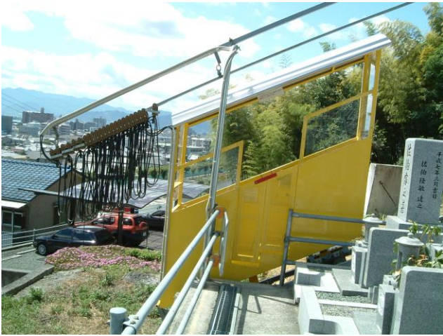
ドアに安全装置付