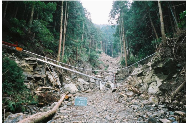
3メートルの空中を走ります