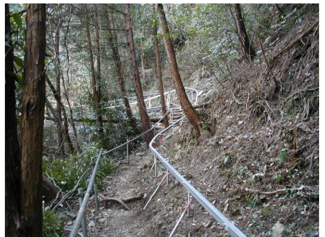
険しい山林の中を走ります