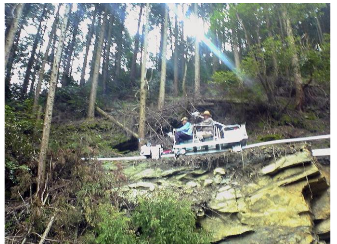
大人2人と貨物80kgでも軽快な走り