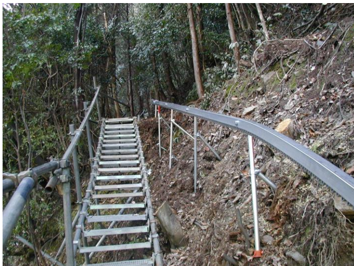
架設階段と並行して登ります