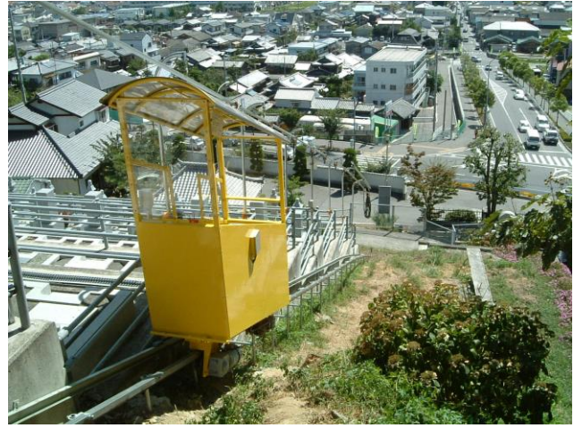
2本レールで揺れなし