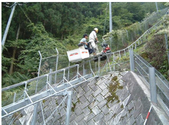
M1000試運転中！快調、快調