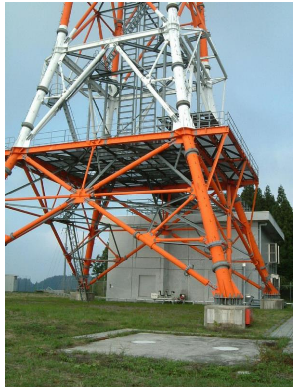
傾斜を登りきった鉄塔のある広場