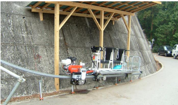
起点の様子 屋根がつかました